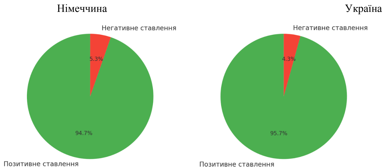
Рис. 1. Ставлення керівників закладів дошкільної освіти до інклюзії

Тобто керівники обох країн відкриті до інклюзивної освіти та відзначають її багатоаспектну користь для дітей з ООП.